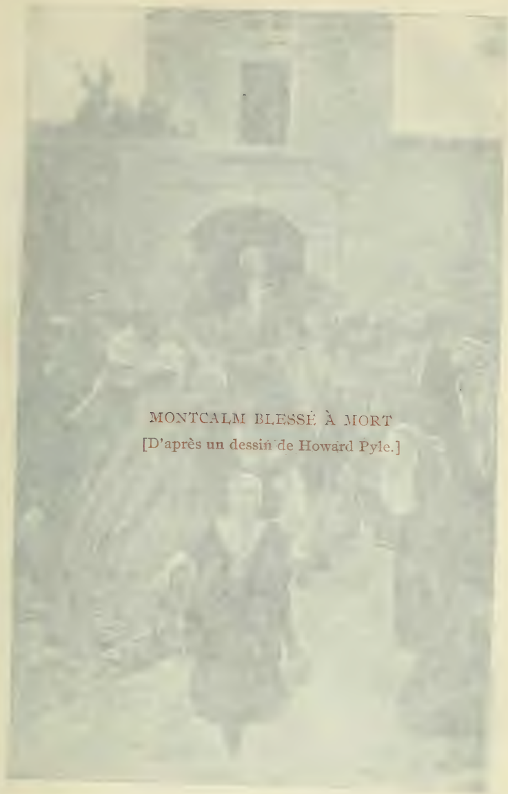
MONTCALM BLESSÉ À MORT [D'après un dessin de Howard Pyle.]